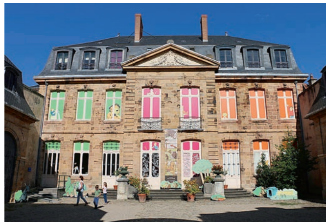
Parmi les nombreux hôtels particuliers de Moulins, l'hôtel de Mora (XVIII e siècle) accueille aujourd'hui le musée de l'illustration Jeunesse.

Cité des ducs de Bourbon, Moulins-sur-Allier offre un patrimoine varié autour de son cœur historique préservé. Musées contemporains et bonnes adresses font de cette préfecture attachante un cadre idéal pour découvrir le riche Bourbonnais.