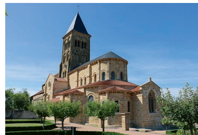
Les villages du Bourbonnais abritent pour la plupart une église romane, construite avec un équilibre parfait.

Coco Chanel figure parmi les personnalités célèbres qui vécurent à Moulins. Lorsque Gabrielle Chanel arriva ici en 1906, elle avait 18 ans. Lorsqu'elle en partit, six ans plus tard, on l'appelait Coco. La jeune femme – qui ne s'était pas encore fait connaître – avait gagné ce surnom en chantant "Qui a vu Coco dans le Trocadéro" dans les cafés de Moulins, fréquentés par les officiers de cavalerie. Un itinéraire de 1,5 km reprend aujourd'hui les principales étapes de la vie de la