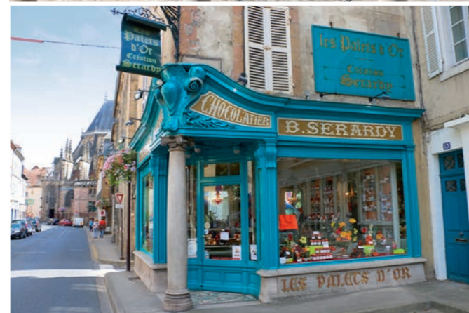
Le cœur historique de la ville conserve de nombreuses boutiques aux ravissantes devantures anciennes. Cette confiserie-chocolaterie est renommée pour ses délicieux palets d'or.

À quelques kilomètres de Moulins, le charmant village de Souvigny possède une très jolie place centrale. C'est aussi la nécropole de la puissante famille des ducs de Bourbon.