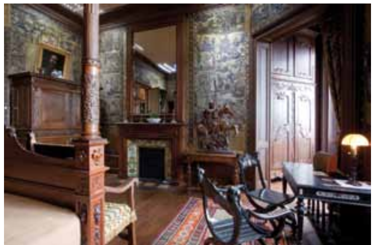
Vue de la chambre de Louis Mantin

Un lit à colonnes supportant un dais plat occupe une grande partie de la pièce. Meuble de la fin du XIX e siècle, il s'inspire des lits de bout apparus aux XV e ou XVI e siècle. Entièrement fermé par des tentures, il est caractéristique du lit « fermé » dit « à la française » comme il se présentait au XVII e siècle.