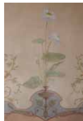
Décor floral peint

La seconde rassemble des décors floraux (bouquets, guirlandes, fleurs diverses et rubans) traités dans un goût naturaliste et charmant, dans des teintes discrètes et fraîches. Quelques oiseaux et insectes viennent animer ces scènes bucoliques. Plusieurs de ces décors, comme ceux de la salle de bain, du plafond de la chambre de femme, évoquent les décors dits de « boutique », si habituels autour des années 1890-1900.