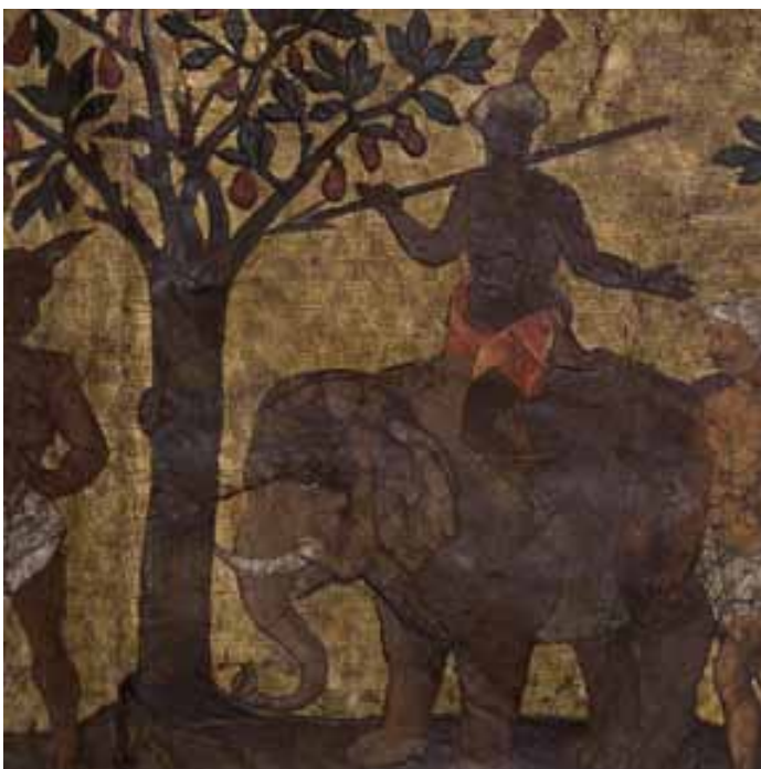
« Cortège d'un Roy chinois », garde armé et coiffé d'un turban sur un éléphant