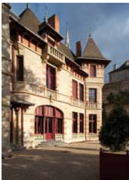
Façade arrière (ouest) de la Maison Mantin