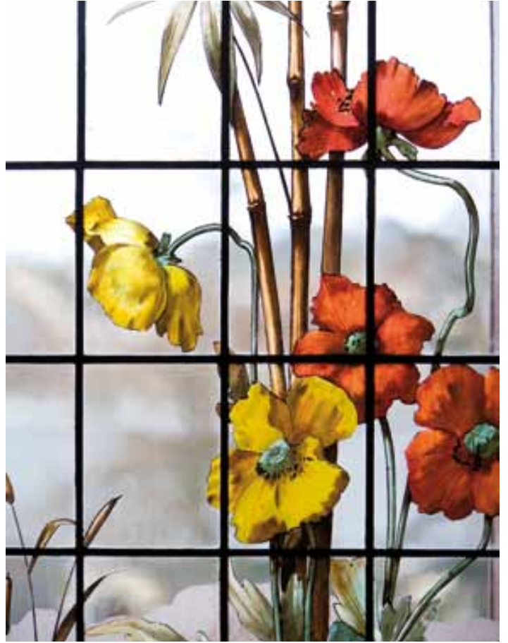
Pavots jaunes et rouges, détail du vitrail , corridor des chambres, 1er étage