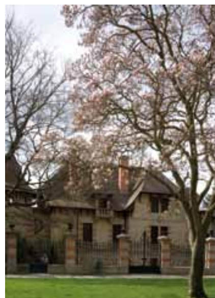
Vue de la Maison Mantin du parc Laussedat, Moulins