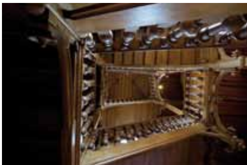
La cage d'escalier : la tradition familiale d'ébénisterie a sans doute joué dans l'utilisation à profusion du bois.

L'escalier fait le lien entre la partie conservée de la maison familiale et la construction neuve. Il est le pivot de la maison et dessert tous les étages. En bois foncé ciré, l'escalier est spacieux et tourne à angles droits. Les murs sont recouverts en partie basse de lambris cirés alors que la partie haute est peinte de couleur ocre sur un crépi gratté. Le long des lambris, court un décor peint de rinceaux et de feuilles stylisées. Au premier niveau, dans le vestibule, ce décor est agrémenté de deux aigrettes dont les plumages arborent des reflets bleus et roses. La cage d'escalier est coiffée d'une voûte en croisée d'ogives, entièrement lambrissée de bois, qui depuis le rez-de-jardin, offre une vue vertigineuse. L'escalier est éclairé par de grandes fenêtres ornées de vitraux. Des tapis anciens sont jetés sur les rambardes. Un grand tableau dépeint les membres de la famille Mantin. Le jeune garçon, à droite, est le père de Louis Mantin.