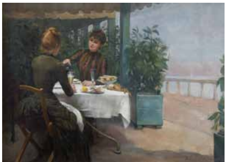
Dîneuses ou Goûter à la terrasse, Paul Chocarne-Moreau (Dijon, 1855 - Neuilly-sur-Seine, 1930), 1885, huile sur toile