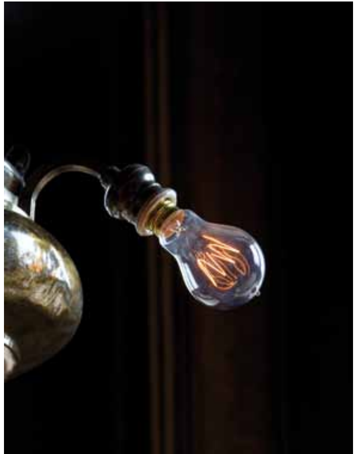
Une lampe d'église ancienne électrifiée par Louis Mantin