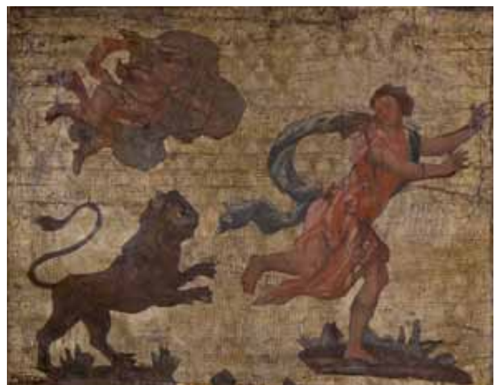
Tysbée retournant à la fontaine pour retrouver son amant