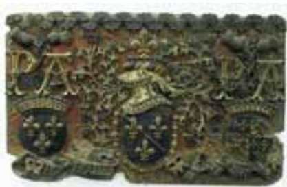
Bas-relief aux armes des Bourbon, bois polychrome et doré, fin du XV e - début du XVI e siècle

Les ducs de Bourbon, notamment Pierre et Anne de Beaujeu ont été de grands mécènes. Ils se sont entourés des meilleurs artistes de leur temps pour donner au duché des bâtiments dignes de son rang. Les grands chantiers qu'ils entreprirent sur l'ensemble de leur territoire attirèrent architectes, peintres, sculpteurs, vitraillistes. Un espace est donc consacré à cet art de la cour bourbonnaise. Il présente notamment :