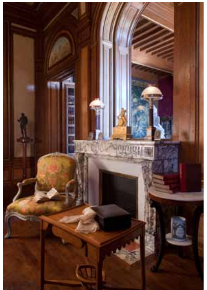
Vue du salon, rez-de-chaussée (en cours d'aménagement)