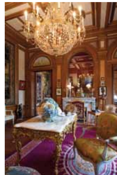
Vue du grand salon

Ce salon d'apparat, de forme carré, comporte un plafond à caissons, blancs et or, ornés de couronnes de feuilles de chêne et de glands rehaussés d'or. Un important lustre Empire à pampilles de cristal et à palmettes en bronze doré cache trois ampoules tricolores ! Mantin manifestait-il ainsi son attachement à la Patrie à une date où la défaite de 1870 – et la perte de l'Alsace et de la Moselle – était dans tous les esprits et rassemblait l'ensemble des Français dans un désir national de revanche ? Une grande baie vitrée, donnant directement sur la terrasse par une volée de marches, est équipée de volets métalliques. Une manivelle, actionnant une vis sans fin, permet de manoeuvrer les volets de la partie supérieure. Une tapisserie marchaise (fin du XVII e ou début du XVIII e siècle) à décor de chasse au sanglier décore le mur opposé. La cheminée de marbre gris est surmontée, non d'un miroir, mais d'un simple vitrage alors que les portes présentent des miroirs. Un jeu de lumières, de transparences, de surprises naît de cet aménagement original. Les dessus-de-porte sont animés de putti dans des scènes champêtres.