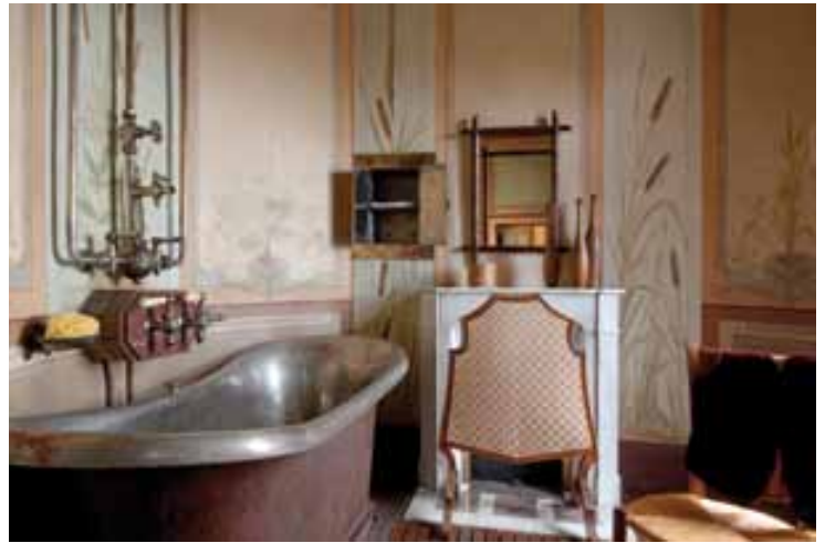
View of the washroom

La salle de bain, de forme hexagonale, propose des aménagements ultra modernes pour l'époque : une baignoire en cuivre étamé alimentée en eaux chaude et froide, une douche et un petit placard branché sur un dispositif permettant de chauffer les serviettes. Le sol est recouvert d'un caillebotis. Au-dessous, une feuille de