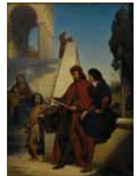
Le Pérugin donnant une leçon à Raphaël Edouard Cibot, huile sur toile, 1842

Avant la création du musée d'art et d'archéologie dans sa configuration actuelle, Moulins a connu plusieurs expériences de collections publiques. Le premier musée municipal, comme dans de nombreuses villes, voit le jour lors de la Révolution française. Face au vandalisme exercé contre les biens de l'aristocratie et du clergé, l'Etat demande aux municipalités de lutter contre le pillage des demeures et églises et de rassembler les objets sauvés. Le district de Moulins nomme donc en 1795 un conservateur qui regroupe ces collections dans la chapelle du couvent de la Visitation. Mais faute de réelle volonté politique, elles seront rapidement dispersées dans divers lieux : églises, lycée... Le 7 mai 1842, le musée de la Ville est créé par délibération du conseil municipal. Quelques toiles appartenant à la Ville au moment de la Révolution ainsi que des dons et des achats forment l'embryon de cette collection. Peu à peu, le musée se déploie dans toutes les salles de l'Hôtel de ville. Les collections sont alors essentiellement composées de peintures et de médailles.