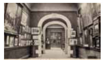
Salles des tableaux - carte postale ancienne