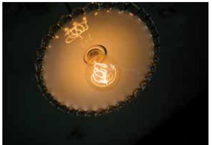
L'éclairage 1900 est conservé