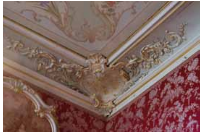
Détail d'un écoinçon stucqué du plafond