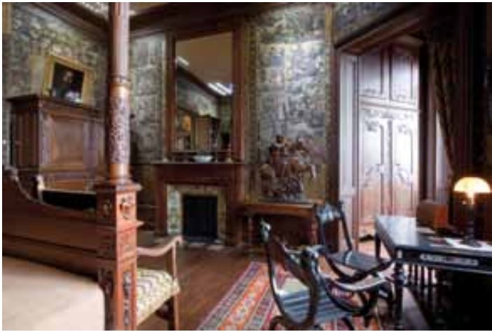
La chambre de Louis Mantin