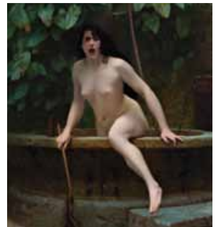
La Vérité , Jean-Léon Gérôme, huile sur toile, 1896