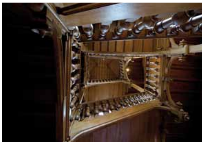
La cage d'escalier vue du rez-de-jardin. La tradition familiale d'ébénisterie a sans doute joué dans l'utilisation à profusion du bois.