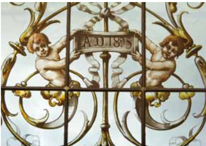
Détail de vitrail, chambre de Louis Martin