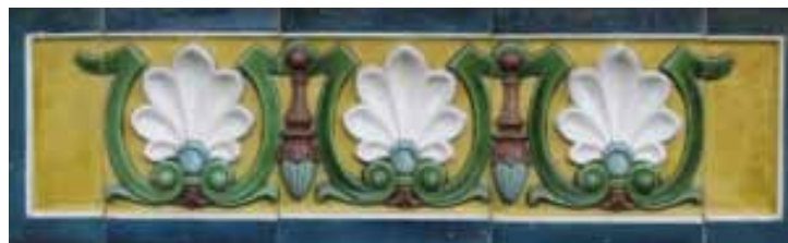
Décor de terre cuite émaillée polychrome sur la façade « ouest » de la Maison Mantin

La Maison Mantin présente un plan asymétrique sur trois niveaux. Elle se caractérise par de nombreux décrochements, des tourelles, des baies de formes variées. Les toits débordants sont couverts de tuiles plates et les pignons sont coupés. Les parements sont construits en pierre aux joints cimentés. Des moulurations horizontales en pierre taillée scandent les étages. Les ouvertures présentent des encadrements en pierre plus claire et en briques. Un décor de terre cuite émaillée polychrome agrémenté les façades.