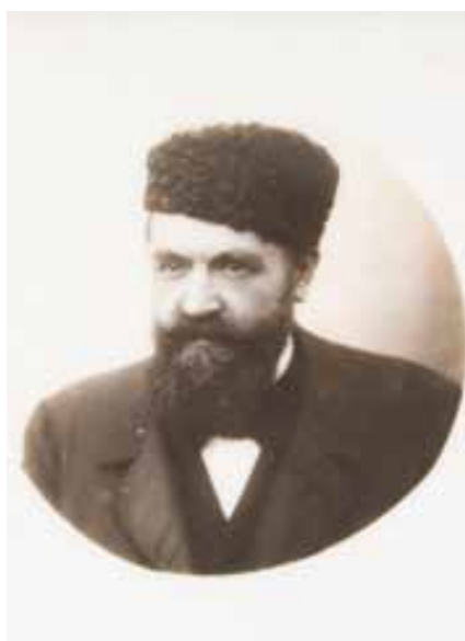
Portrait à la toque d'Astrakan, photographie sur plaque céramique