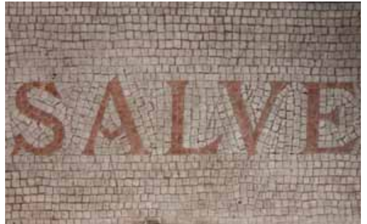
Cette mosaïque salue les visiteurs à l'entrée de la Maison