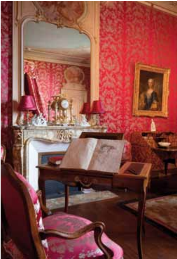
Vue de la chambre de femme