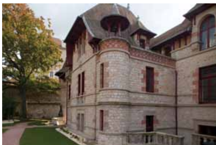
Façade avant (est) de la Maison Mantin