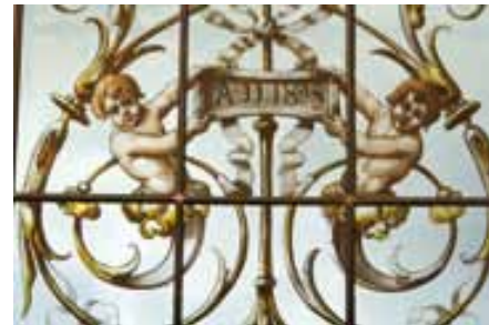
Détail de vitrail, chambre de Louis Mantin

La fin des travaux s'échelonne entre 1895 et 1896. L'inscription de l'observatoire et un vitrail présentent la date de 1895 alors que les peintures décoratives exécutées par Auguste Sauroy consacrent certainement l'achèvement du décor en 1896.