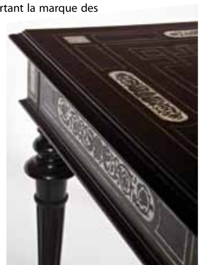
Table, fin du XIX e siècle (après 1889), bois, poirier teinté, palissandre teinté, ébène, incrustation de filets de laiton et d'étain, galalithe marquetée et gravée

La dernière catégorie est formée par le mobilier usuel de la fin du XIX e siècle qui peut être qualifié de « moderne ». Ces meubles se retrouvent facilement dans les catalogues de vente de l'époque. L'ensemble des meubles présentés a nécessité des restaurations spécifiques : renforcement structurel, reprise des placages et des marqueteries, nettoyage des bronzes et des marbres par exemple. Les sièges ont fait l'objet d'une attention particulière et d'une réflexion conduite au cas par cas.