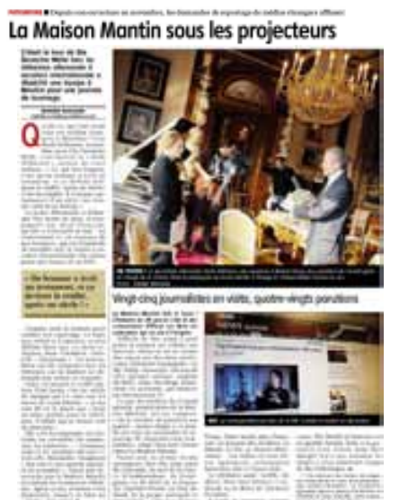
Journal d'Allier - OCT 10 Mensuel - Surface approx. (cop): 396