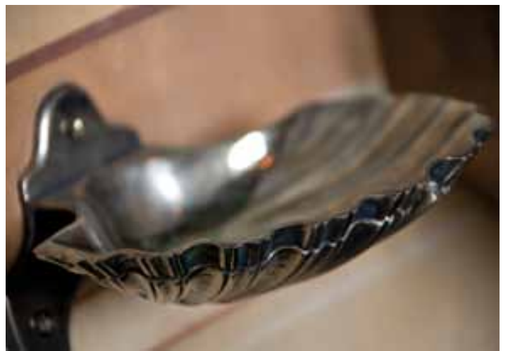
Porte-éponge, salle de bain