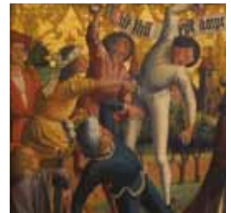
Retable de Saint-Etienne (détail) , attribué au maître d'Uttenheim et à Michaël Pacher, vers 1470