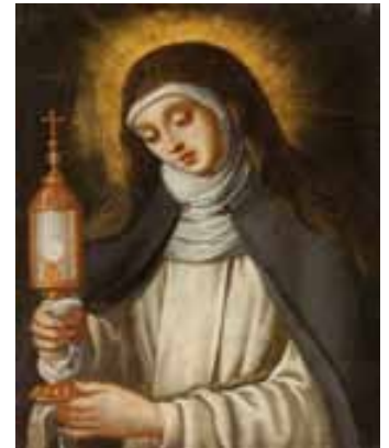
Sainte Claire, école espagnole, huile sur cuivre, 1 ère moitié du XVII e siècle, coll. cathédrale Notre-Dame de Moulins