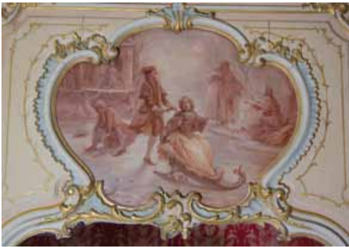
Dessus-de-porte « L'hiver », chambre des Quatre saisons