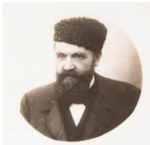
Portrait à la toque d'Astrakan, photographie sur plaque céramique