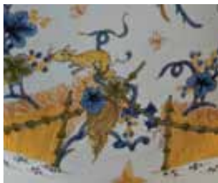
Assiette, faïence stannifère à décor de grand feu polychrome, Moulins, vers 1750