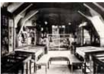
Vue du musée - salle du palais de justice

Fondée en 1845, la Société d'Emulation du Bourbonnais se donne pour mission « de s'occuper activement de former une collection d'objets d'art [en donnant] avant tout la préférence à ceux qui auraient été découverts dans le département de l'Allier ». Cette collection ne débute finalement qu'en 1851, à l'occasion de fouilles archéologiques sur la commune voisine, Yzeure. Devant l'importance des collections acquises, la Société sollicite les pouvoirs publics pour gérer ce patrimoine. C'est ainsi qu'en 1861, le Département dégage les fonds nécessaires à la création d'un musée départemental à la condition que la Société y mette en dépôt l'ensemble de ses collections. Un second musée est donc inauguré à Moulins le 15 août 1863 dans les bâtiments du palais de justice.