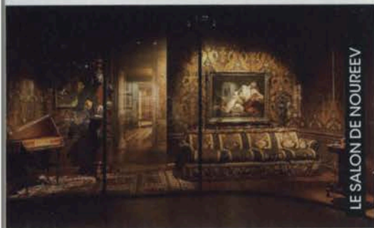
LE SALON DE NOUREEV