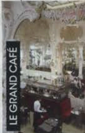
LE GRAND CAFÉ

OÙ RETROUVER COCO ? En téléchargeant l'application Sur les pas de Coco Chanel à Moulins. Un parcours de 1,5 kilomètre ponctué des lieux emblématiques fréquentés par Gabrielle Chanel pendant ses six années passées à Moulins. www.everytrail.com